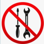
Aarnesi da lavoro