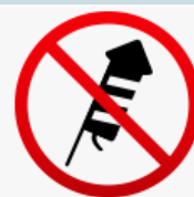
Sostanze e dispositivi esplosivi