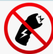
Dispositivi per stordire