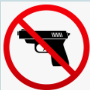
Armi da fuoco